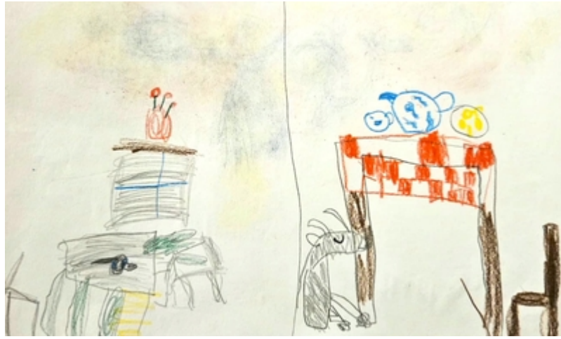
Gli animali invadono la casa