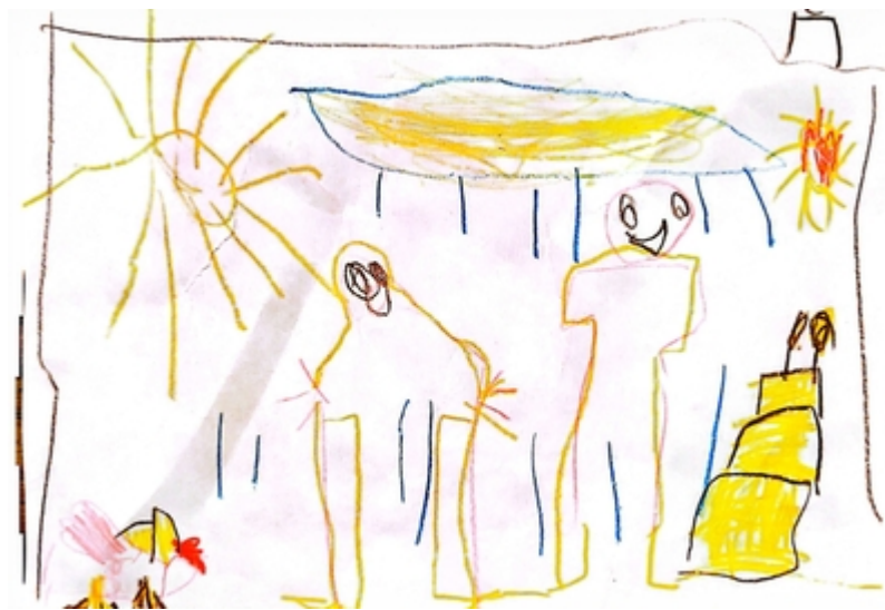
La casa è piena