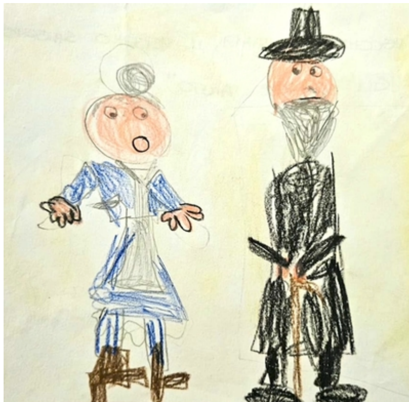
La vecchina chiede aiuto al vecchio saggio