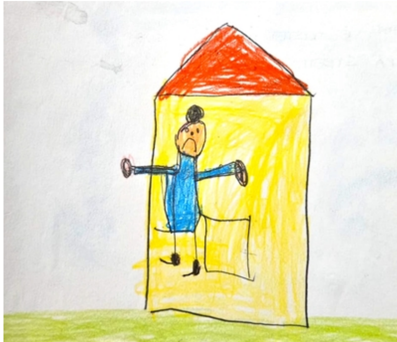
La casa non è molto grande e la vecchina manifesta con evidenza il suo disappunto.