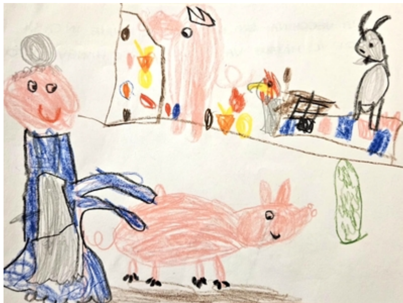
La casa è piena